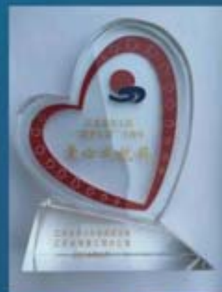
青少年发展基金会