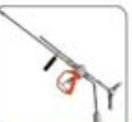
1/8"系列高压水射流喷嘴系列