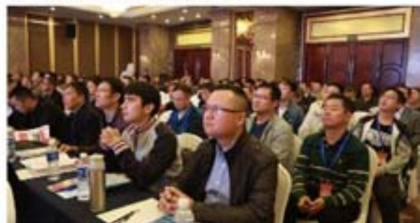
代表们在认真听大会报告

在论坛会场的外面，专门设置了产品展示区域，北京蓝星清洗有限公司、上海水能金属科技有限公司、天津市三盛九和安全技术服务有限公司、北京华瑞盟科技有限公司、天津市精诚高压泵制造有限责任公司、上海水威环境技术股份有限公司、阿特拉斯科普柯（上海）贸易有限公司、埃克森美孚化工、意大利 TRANSFER OIL、伦敦流体科技（上海）有限公司、天津福禄机电设备有限公司、上海深盟设备制造有限公司、思辉流体科技（上海）有限公司等企业都设置了各自的展台，在技术交流的间歇与参会代表可以进行商务洽谈。