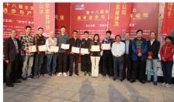
获奖优秀论文作者代表与嘉宾合影

会议期间，经过参会代表的投票和认真评分，《污水沉降罐机械清洗系统的研制》、《一种高性能多用途飞机维护用环保型溶剂清洗剂应用研究》、《机车车辆外表面酸性水基清洗剂的研制》、《火力发电厂废水“零”排放工艺综述》、《液压管路高洁净清洗技术研究与应用》、《脉冲激光清洗的作用机理及清洗表面性能提升研究》、《高压水清洗用喷枪阀和脚踏阀的升级改造》、《飞机污水管道清洗剂的开发研究》、《调距桨轴系内孔清洗工艺开发及应用》、《飞机铝合金零件表面激光脱漆工艺技术研究与应用》、《闭式联合空气冷却器清洗装置》、《移动式加油站埋地油罐循环清洗系统的研发与应用》、《聚酯多元醇冷却水系统运行前的化学清洗与钝化预膜》、《压水堆卧式蒸汽发生器化学清洗方法的优化》被评为本届论坛的优秀论文。