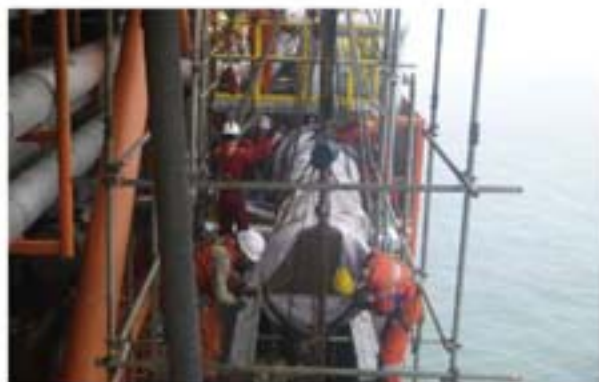
图3 外挂平台舷外高空作业

这个项目（见图3、图4）是外挂平台舷外高空作业，需要搭设8米高的工作平台和吊点，需要考虑吊索具的吊点角度和悬挂多少倒链，是不是能承受吊装负重和满足人员工作的重点，还要考虑吊车是否能把芯体吊出来。另外因为靠海面那么近不能造成海洋污染，将每个细节考虑好才能保障工作安全顺利完成。