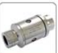
1/4"系列高压水射流喷嘴系列