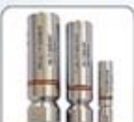
3/8"系列高压水射流喷嘴系列