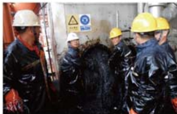
图2 清洗完工后胜利的微笑

要把罐内近200方清清的污油泥清理出来达到动火标准，工人付出的汗水与劳累被顺利完工后的会心微笑所代替（见图2）。