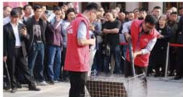
演示现场精彩瞬间

在论坛设置的演示场地上，上海水能金属科技有限公司、上海水威环境技术股份有限公司、天津市精诚高压泵