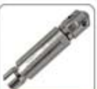
1/4"系列高压水射流喷嘴系列