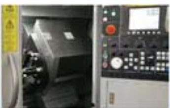
进口高精度车削中心