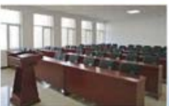
高压水射流学术交流及培训中心