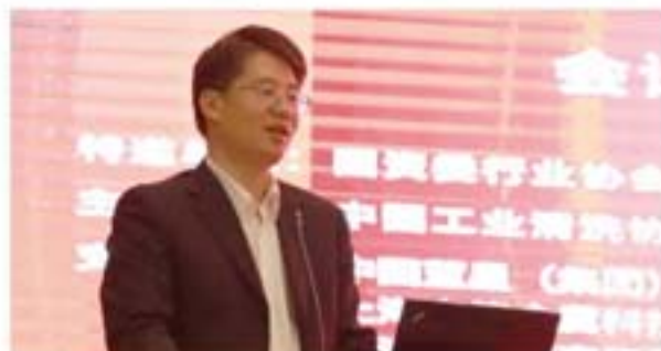
方长安副局长讲话

国资委行业协会商会工作局方长安副局长向大会表示了祝贺，并就协会党建工作作出了重要指示。他强调，协会是政府工作改革的重要帮手，协会开展工作首先要切实加强党的领导，为协会建设发展发挥作用，提供更加有力的政治保障。方局长对本届论坛积极践行“十九大”精神，以“新时代、新思想、新技术、新成果”为大会主题，组织会议内容，在以民营企业占绝大多数的会员企业中宣传党建工作的重要性和党建工作的优秀经验非常赞赏。希望协会今后继续贯彻创新、协调、绿色、开放、共享的发展理念，积极探索、勇于实践，开展有利于行业发展的各项新举措。方局长强调，学习贯彻党的十九大精神，最终要转化为推动行业发展新要求、协会建设新促进这一新的生动伟大实践。要以党的十九大精神为指引，努力推动新的时代条件下的行业集群发展，善于用系统联系的眼光发现新时代行业发展新契机，把握新机遇。