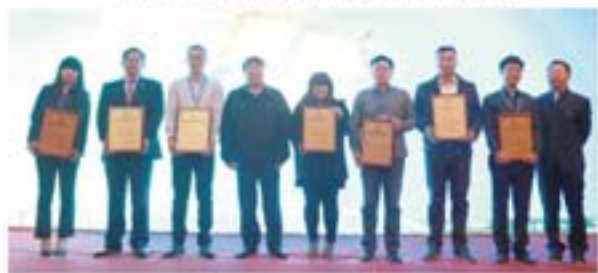
颁发第一批行业品牌产品证书