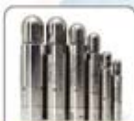
1/2"系列高压水射流喷嘴系列