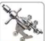
3/8"系列高压水射流喷嘴系列