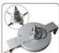
高压水射流清洗系统