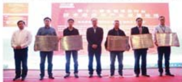
颁发第一批清洗化学品委托验证中心铜牌

论坛开幕式上，中国工业清洗协会发布了行业首批行业清洗化学品验证中心和首批工业清洗行业品牌产品。其中，由北京蓝星清洗有限公司、北京乐文科技发展有限公司、华阳新兴科技（天津）集团有限公司、广州市人和清洗有限公司、兰州蓝星清洗有限公司分别建设的5家产品验证中心成为行业首批清洗化学品验证中心。由万博克环保科技（北京）有限公司开发的VTC-R系列油罐清洗系统，华阳新兴科技（天津）集团有限公司开发的安普克系列等溶剂型清洗剂、净丝特系列等水基型清洗剂、安泰特系列防锈剂，北京蓝星清洗有限公司开发的LX2000-007三合一常温清洗剂，兰州蓝星清洗有限公司开发的LX1-005C金属油污清洗剂、Lan-826多用酸洗缓蚀剂、LX1-002无苯退漆剂，天津市精诚高压泵制造有限责任公司开发的JC3201高压柱塞泵，欣格瑞（山东）环境科技有限公司开发的SGR-0405多功能酸洗缓蚀剂，沈阳仪表科学研究所有限公司开发的QXXT-00大型空冷