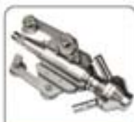
1/2"系列高压水射流喷嘴系列