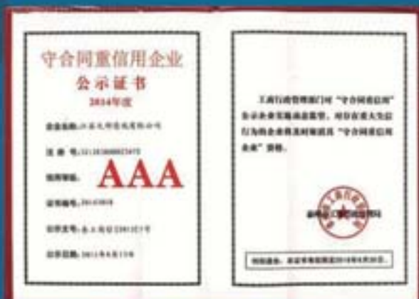
守合同重信用 3A 证书