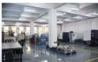
天津福祿公司生产车间