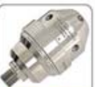
1/4"系列高压水射流喷嘴系列