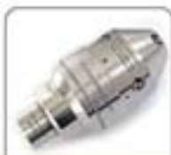
1/2"系列高压水射流喷嘴系列