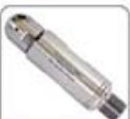
3/8"系列高压水射流喷嘴系列