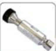
1/4"系列高压水射流喷嘴系列