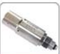
3/8"系列高压水射流喷嘴系列