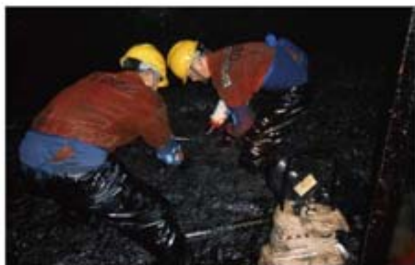
图1 清洗罐内现场情景

很多人不明白（图1中的黑色物）这是何物，这就是清罐作业中需要清理的聚合物油泥。我们从事的作业就是和黑色的油泥打交道，所以我们人称黑色清洗人。