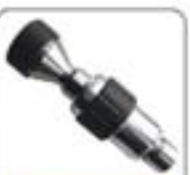
1/8"系列高压水射流喷嘴系列