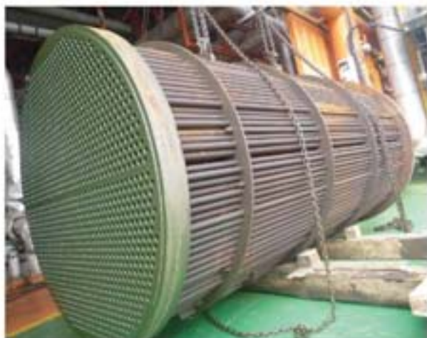
图6 清洗后的换热器内芯

清洗作业部领队20多人，或内敛，或热情，正是这种不同性格特征的人组成了清洗铁军，但他们身上都有着共同的职业性格就是严谨、专业、高效、责任、担当。他们一次又一次的高效地完成各种施工作业，用专业素养赢得了平台方、领导、同事的尊重与信任。真正塑造人格的是挫折和苦难，人们不由赞叹：“清洗铁军，好样的！”