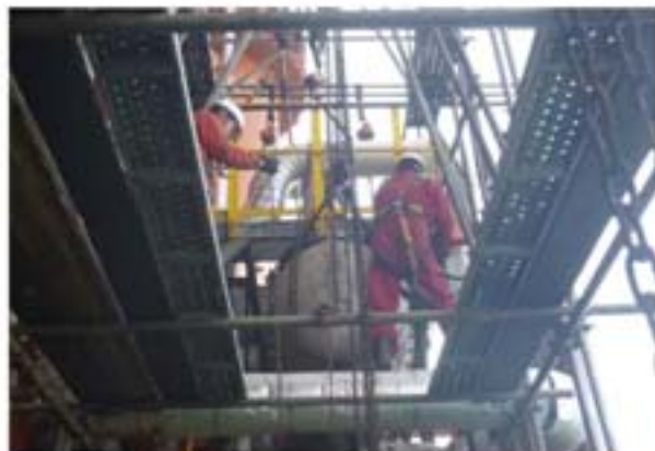
图4 外挂平台舷外高空作业

把一个4吨多重芯体抽出来，落到下面进行清洗后再回装，从8米的高空作业，人员、设备、安全、环保都要考虑，否则后果可想而知呀！