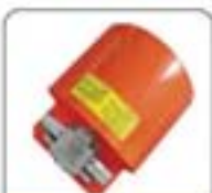
1/2"系列高压水射流喷嘴系列